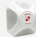
Loa âm thanh OS-2502