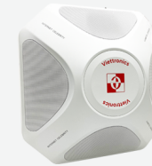
Loa âm thanh OS-2501