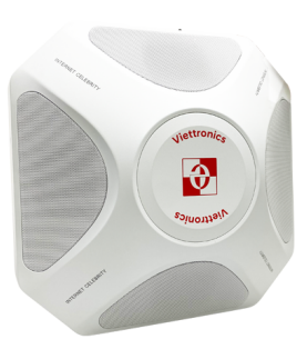
1 loa chủ OS-2501