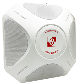
1 loa chủ OS-2502