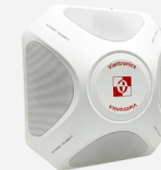
Loa âm thanh OS-2501