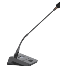
Micro để bàn không dây