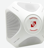
Loa âm thanh OS-2502